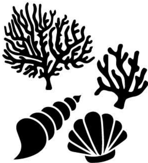
Ракушки и кораллы